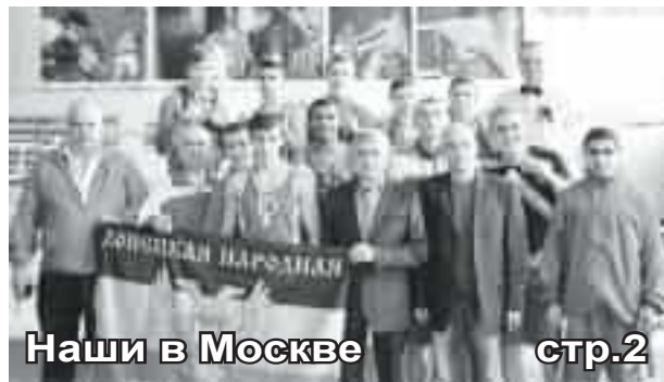
Наши в Москве