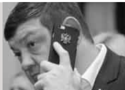
помощь» люди несут цветы.

На данный момент к фонду Доктора Лизы в Москве «Справедливая