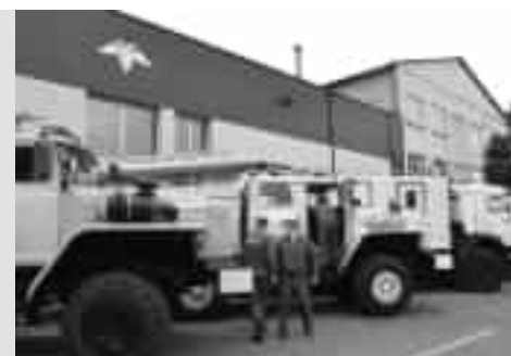
артобстрелов Донецка и Горловки силы МЧС привлекались четыре раза.

«Всего с начала года подразделениями МЧС ликвидировано 56 пожаров вследствие артобстрелов», — сказал Зарубин. Он отметил, что на этой неделе на пожары в ходе