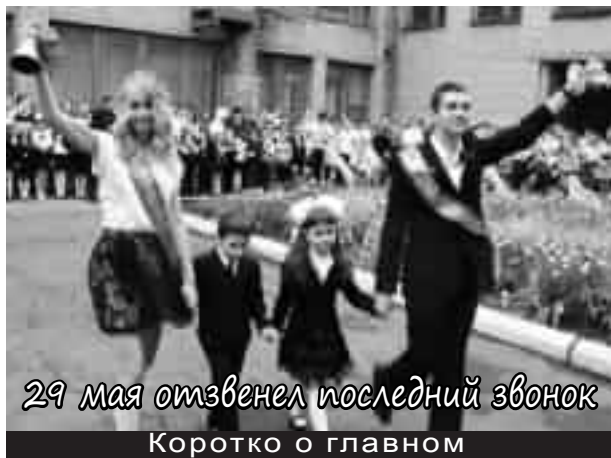
29 мая отзвенел последний звонок Коротко о главном