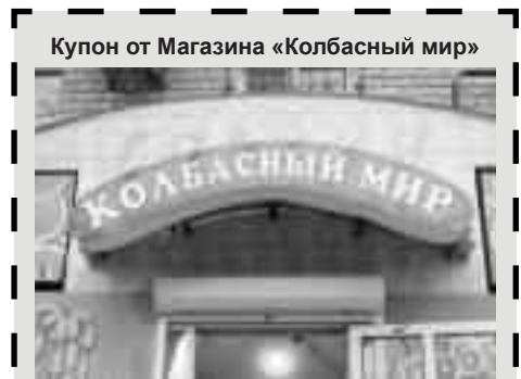
Купон от Магазины «Колбасный мир»