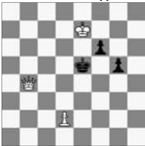
Белые начинают и ставят мат в 2 хода.