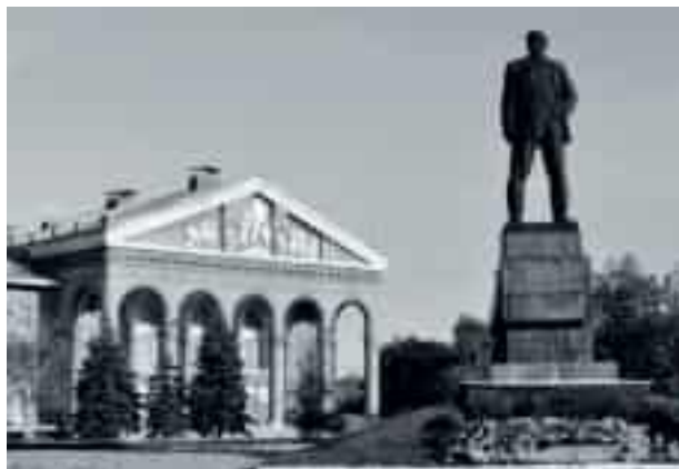
Коротко о главном