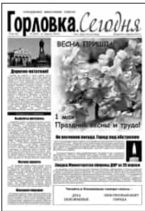
Первый номер газеты «Горловка. Сегодня»

Как известно, газета выходит каждый четверг и за все 5 лет мы