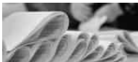
График отвода вооружений стал камнем преткновения на переговорах подгруппы по безопасности

Глава ДНР Александр Захарченко 16 сентября подписал указ о проведении выборов в местные органы самоуправления. 18 октября граждане будут выбирать руководителей 13 городских и четырех районных администраций. Избрание руководства остальных уровней, в том числе сельского и поселкового, планируется на последующих этапах кампании, которая продолжится в первом полугодии 2016 года.