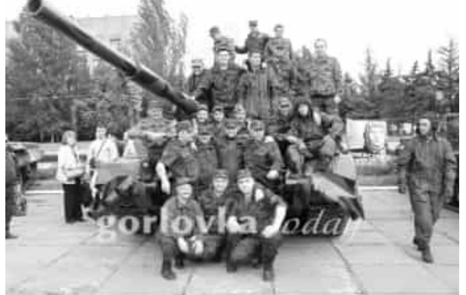
Броня крепка и танки наши быстры. Пусть знают это злые враги

Этот день раньше играл немалую роль в сознании жителей страны – на протяжении нескольких лет, в 40-50-ые годы XX-го века, на площадях проходили парады с участием тяжелой техники. В нашем городе, 13 сентября была организована демонстрация, на которой можно было увидеть образцы военной техники, а именно танков различных моделей, которые сейчас стоят на вооружении армии ДНР и которые защищают нас от фашистов. На демонстрации также присутствовала полевая кухня.