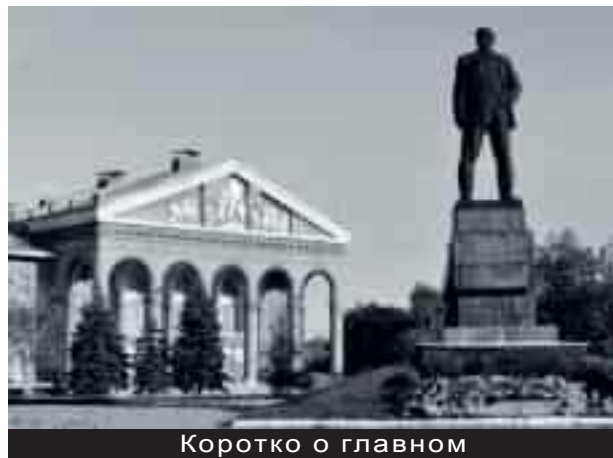
Коротко о главном