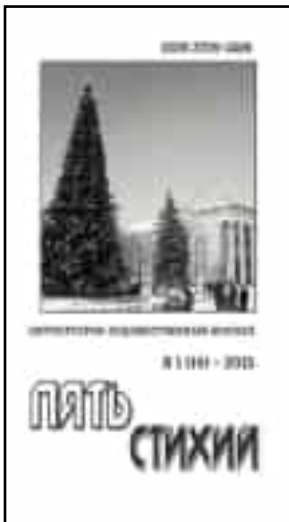
В номере свои поэтические работы представили молодые горловские коллеги журнала. Она

Вам необходимо стратегически правильно построить свои отношения с партнерами по работе, и тогда многие проблемы решатся сами собой.