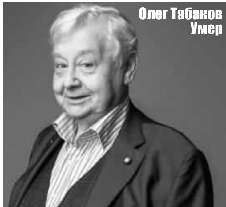
Олег Табаков Умер

В Москве умер народный артист СССР, художественный руководитель МХТ им. Чехова и «Табакерки» Олег Табаков, сообщили в пресс-службе театра.