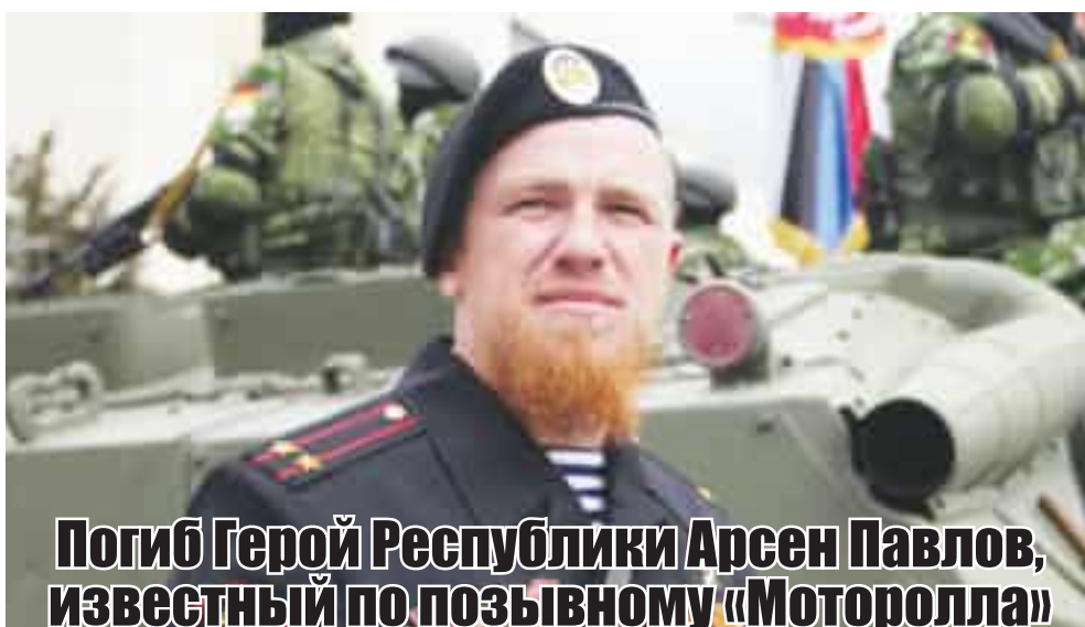
Погиб Герой Республики Арсен Павлов, известный по позывному «Моторолла»

Горловчане имеют возможность присоединиться к наведению порядка в городе. 22 октября пройдет 2-й общегородской субботник, в ходе которого будет проведена уборка территории от опавшей листвы, а также высадка саженцев деревьев и кустарников.