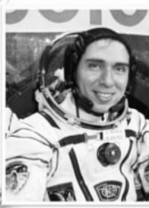
Волков Сергей Александрович — российский космонавт, лётчик-космонавт-испытатель. Сын космонавта, Героя Советского Союза Александра Александровича Волкова. Первый в мире космонавт во втором поколении.

На его счету 3 полета и почти 400 суток на орбите. Он улетал в космос из СССР, а возвращался уже в другую страну. Его мужество отмечено Золотой Звездой Героя Советского Союза. Именно он готовил почву для будущих свершений на станциях «Салют-7» и «Мир».