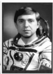
Волков Александр Александрович — советский и российский лётчик-космонавт, Герой Советского Союза

Говорят, что небо выбирает лучших, но иногда оно становится семейным делом. История Александра и Сергея Волковых — это уникальный пример того, как мечта о звездах передается по наследству.