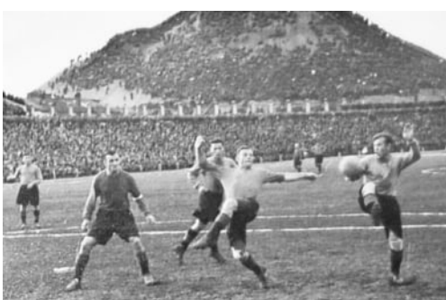
Донецк (Сталино), 1951 год, стадион "Шахтер".