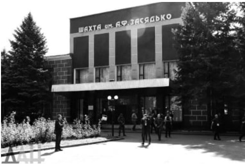
Шахта им. А.Ф. Засядько.

последних достижений науки, их мощность измерялась миллионами тонн. Засядько активно продвигал комплексную механизацию: внедрялись новые комбайны, конвейеры, средства автоматизации. Но его инновации не ограничивались забоем. Министр был одним из инициаторов создания мощной угольной науки в самом регионе, укрепляя Донецкий научно-исследовательский угольный институт и профильные кафедры в институтах, понимая, что решения должны рождаться в непосредственной близости от пластов.